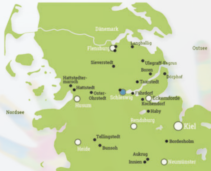
Der Sitz der IKH-Geschäftsstelle befindet sich in Schleswig.

Sie verbindet die gemeinsame Vorstellung von Engagement und Qualität in der pädagogischen Arbeit.